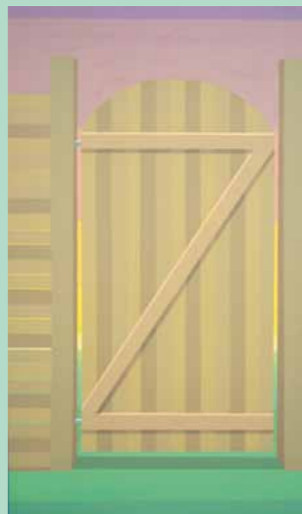
Puerta 40 cm x 70 cm / Acrílico Sobre Tela 2018

Tres Arroyos. Mención Bienal de Artes Visuales AreaTEC -Buenos Aires-. (2013) 1er Premio Adquisición VI Premio de Pintura Banco de Córdoba. (2010) 1er Premio Adquisición, Estímulo Banco de la Provincia de Buenos Aires. (2009) 1er Premio Adquisición XXVI Salón Nac. de Pintura y Dibujo -Ciudad de Azul-. (2008) 1er Premio Adquisición Salón Prov. de Pintura de Necochea. Ha realizado importantes muestras individuales como: "Caminos Metafísicos", Mundo Nuevo Art Gallery -Buenos Aires- (2013). Museo de Arte Contemporáneo Raúl Lozza -Alberti, Pcia de Buenos Aires- (2007), además de una veintena de participaciones en muestras colectivas y salones en Argentina y el exterior. Sus pinturas han sido reproducidas en importantes libros y catálogos y están presentes en colecciones públicas y privadas en la Argentina.