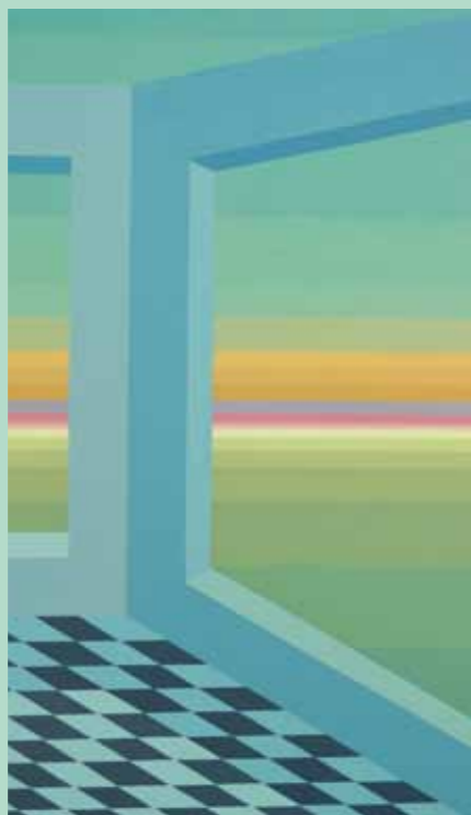
Espera (Detalle) 70 cm x 100 cm / Acrílico Sobre Tela 2018

Algunos de los premios obtenidos por el artista incluyen: (2015) 1er Premio Adquisición XLIV Salón Nac. Arte Sacro Mumbat -Tandil-. 2do Premio Adquisición VI Concurso Prov. de Artes Visuales CPA -Honorable Cámara de Senadores de la Prov. de Bs .As-. (2014) 2do Premio XXXXIII Salón Nac. Arte Sacro Mumbat -Tandil-. 1er Premio Adquisición IX Salón Nac. de Dibujo y Pintura Museo Mulazzi-